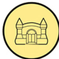
Nowy, zamek dmuchany