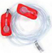
1 zestaw spryskiwacz i adapter